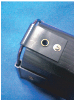
旧型はワイヤーがむき出しです。